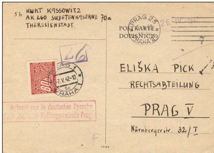
Postkarte aus dem Ghetto