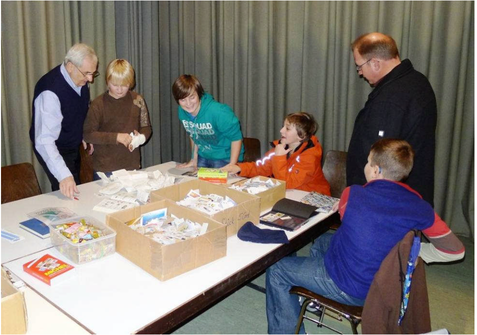
Gruppenmitglieder bei der „Arbeit“: Briefmarken, Kataloge, Rätsel, ...